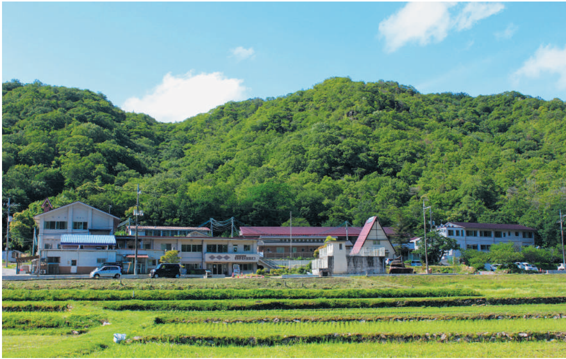
ももぞの学園全景