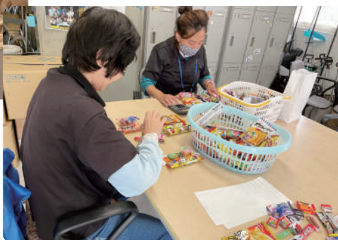
【駄菓子セットの袋詰め真っ最中です】