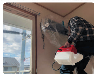
【エアコンの清掃も承ります!】